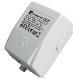
PFS20S - Transformator 230/24 VAC.